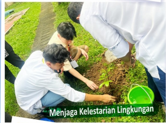
Menjaga Kelestarian Lingkungan