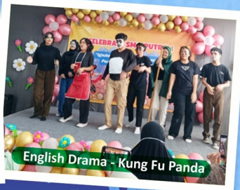
English Drama - Kung Fu Panda

Untuk mencapai visi tersebut, SMA Putra 1 menerapkan pendekatan pendidikan holistik yang terintegrasi dalam setiap aspeknya. Proses pembelajaran kami memadukan metode tatap muka yang menantang dengan pemanfaatan teknologi digital melalui platform Moodle untuk menumbuhkan kemandirian belajar.