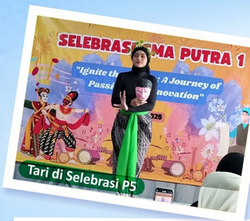
Tari di Selebrasi P5