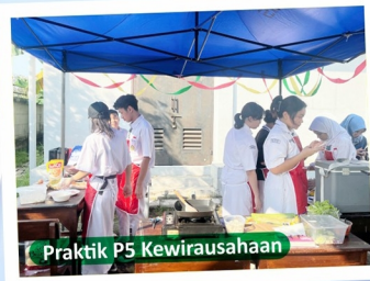
Praktik P5 Kewirausahaan