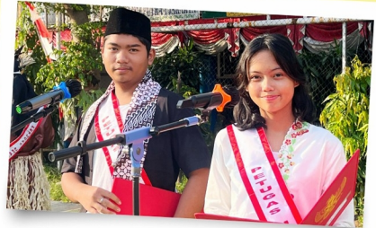
Petugas Upacara HUT RI