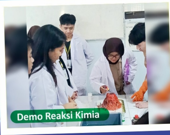
Demo Reaksi Kimia